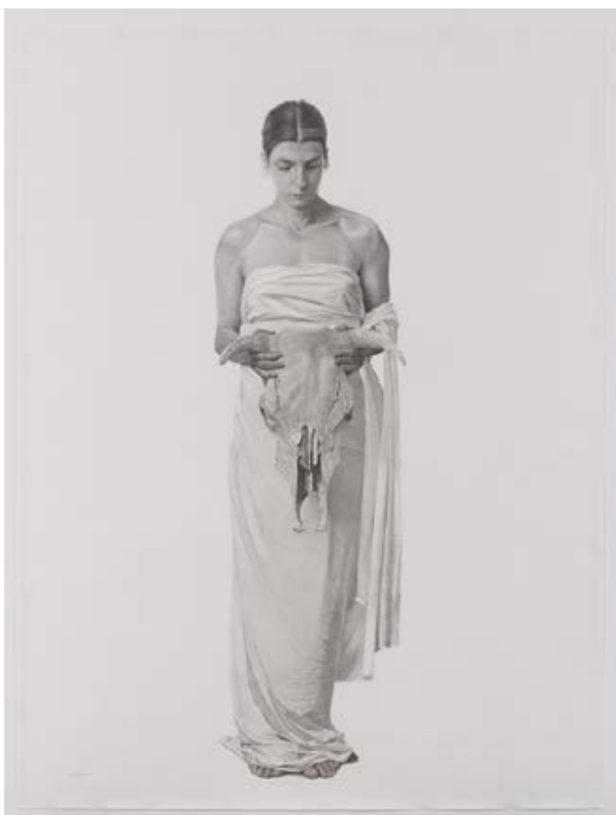
פחם על נייר 200/150 ס"מ חיפה, 2019