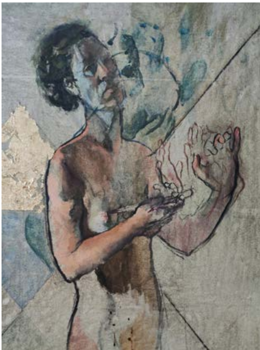
טכניקה מעורבת 120\70 ס"מ תל אביב, 2021