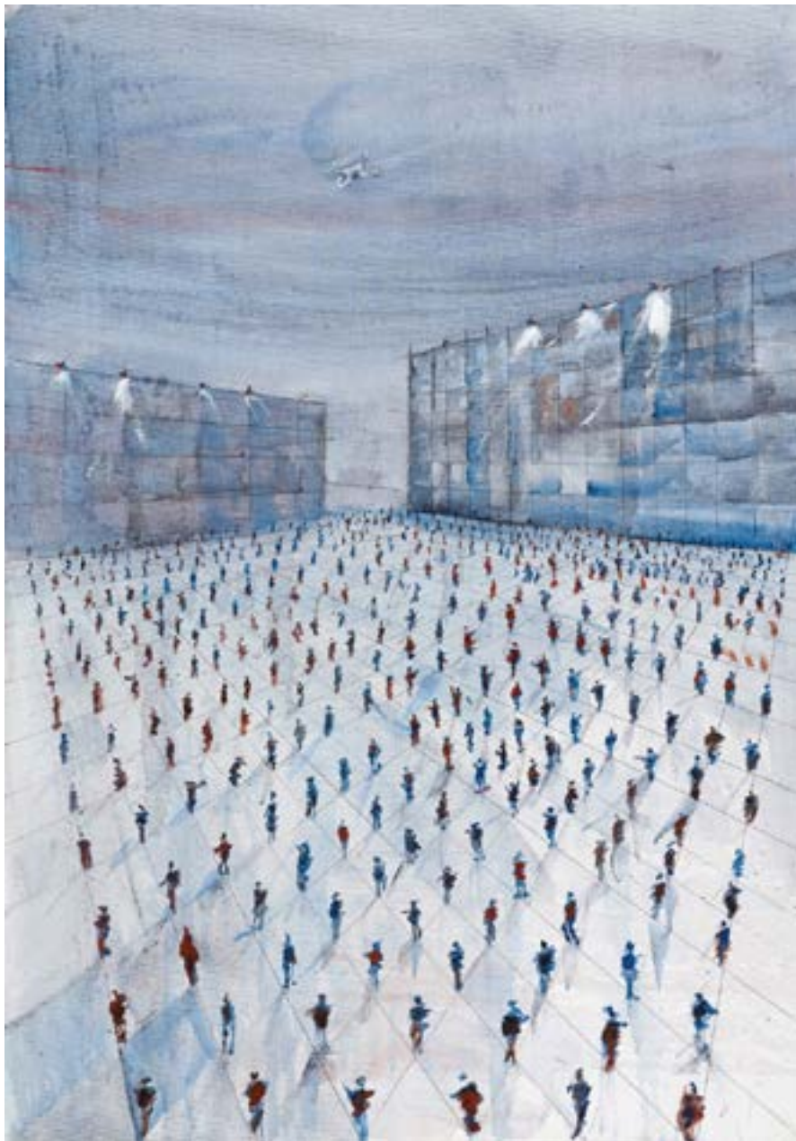
אקריליק על בד 100x70 ס"מ תל אביב, 2020