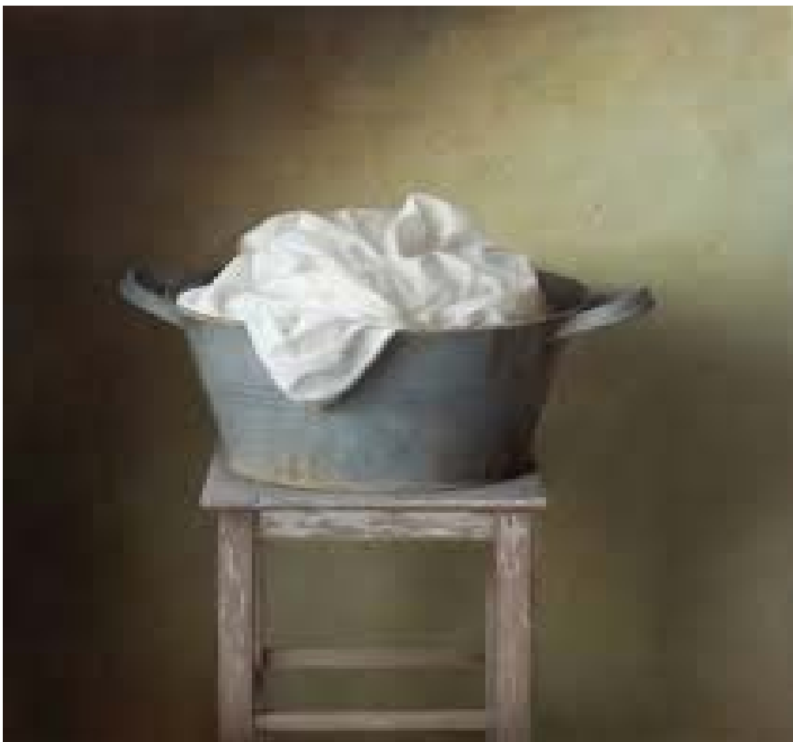
שמן על עץ 80\90 ס"מ ישראל, 2020