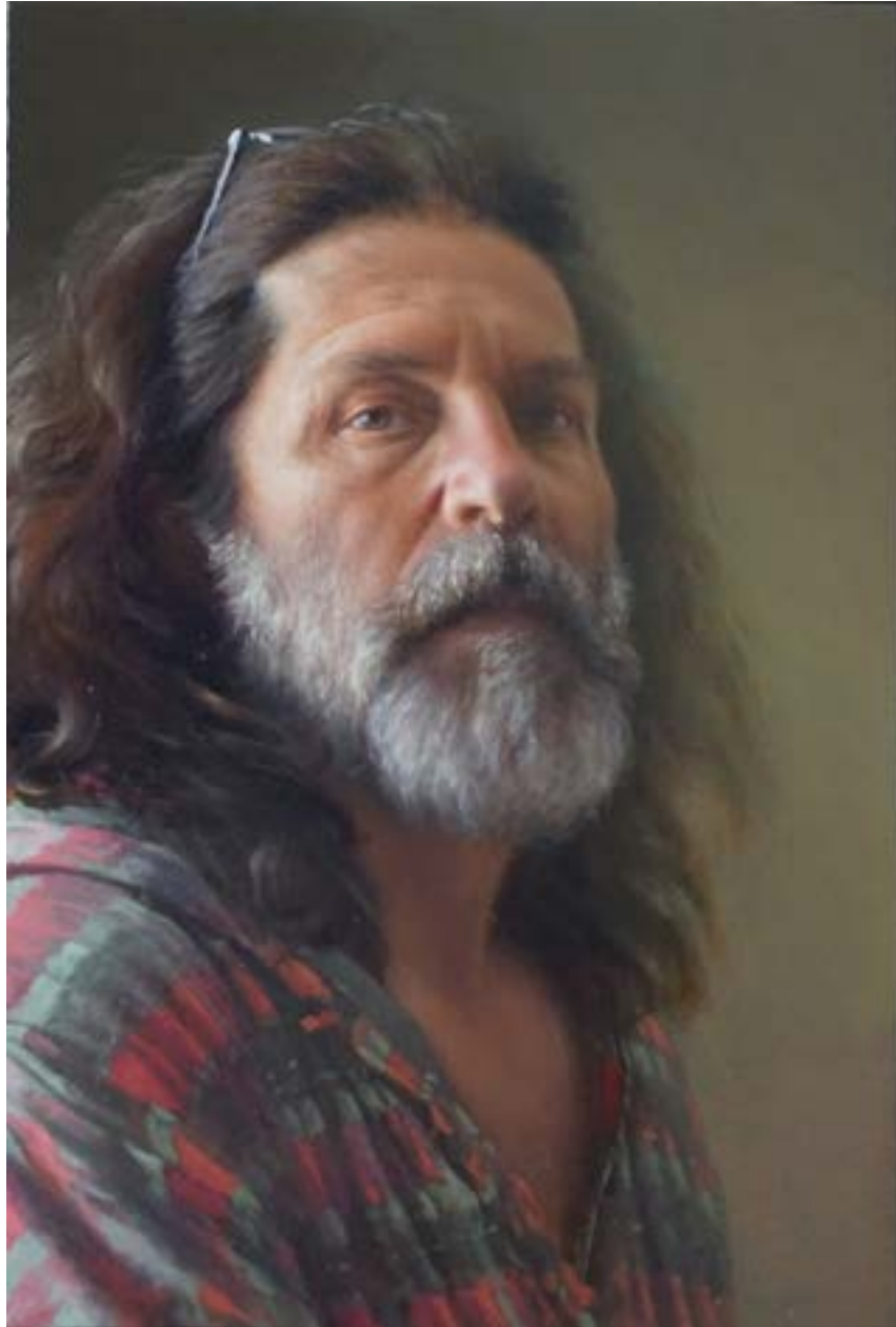
שמון על בד מודבק על עץ 44/29 ס"מ ניר עקיבא, 2020