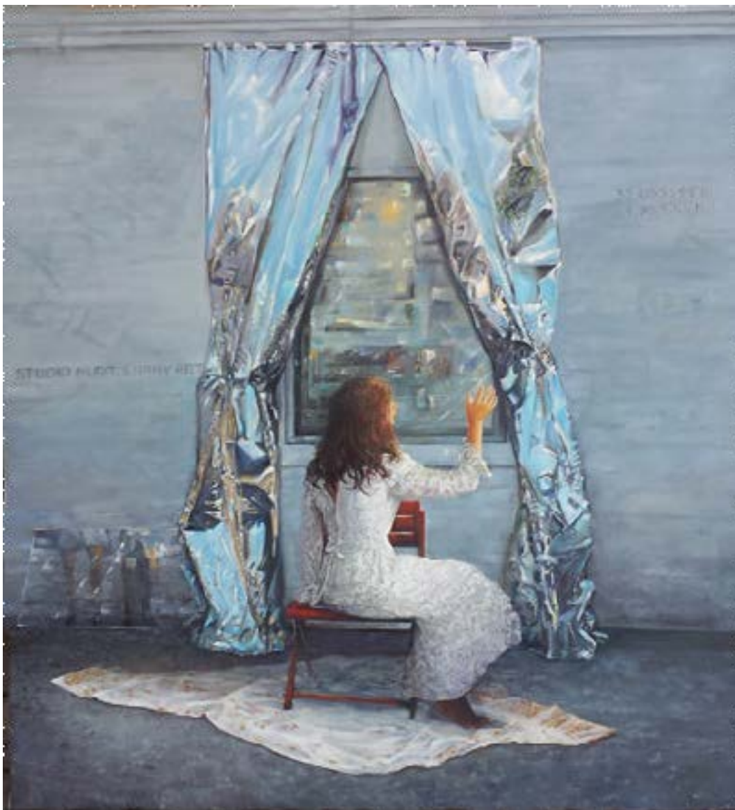
שמן על בד 100/120 ס"מ תל אביב, 2020