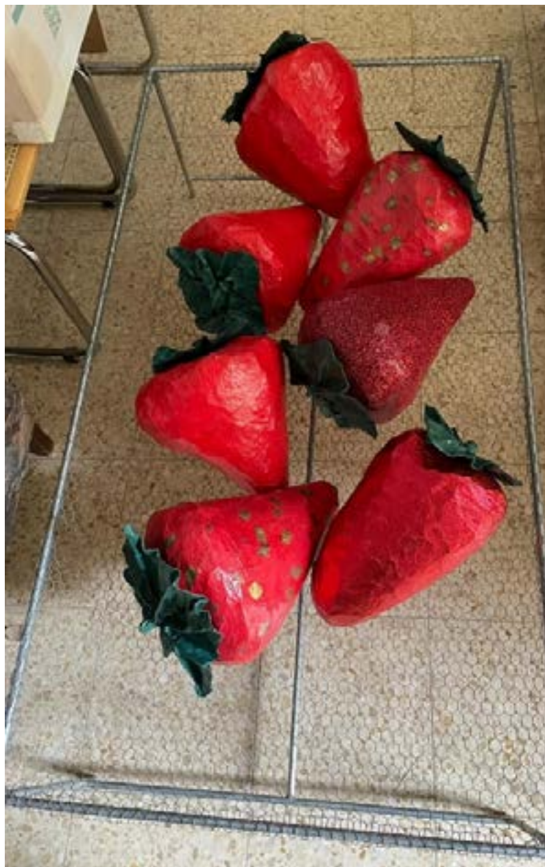
רשת לולים עטופה בניירות עיתון וניירות צבעוניים 35/70/130 ס"מ ירושלים, 2020