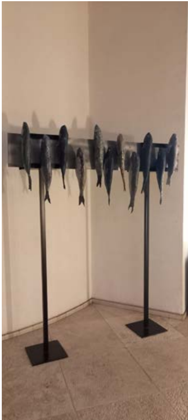
רשת לולים עטופה בניירות עיתון וניירות צבעוניים 160\30 ס"מ ירושלים, 2020-2021