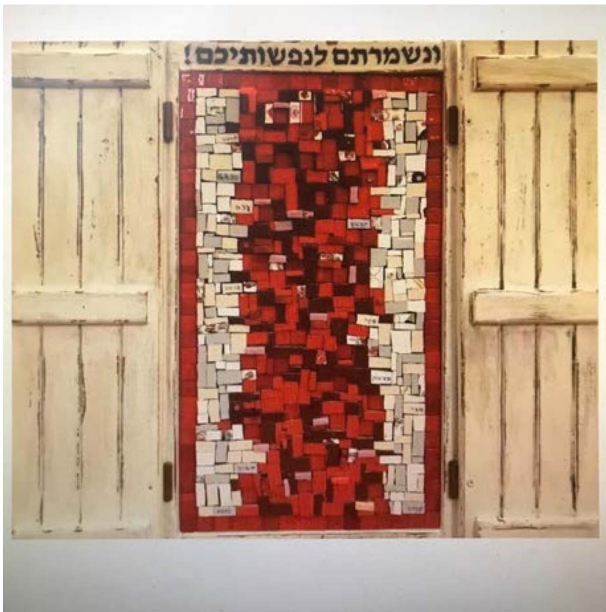
פסיפס 50\55 ס"מ גן יאשיה, 2020